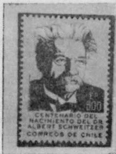
E° 500 — rojo y amarillo

Este sello, cuyo decreto de emisión publicamos en el número anterior, fue puesto en circulación el 7 de abril, empleándose un matasellos de primer día; y se imprimió en pliegos de 100 ejemplares (10 x 10), en papel blanco liso: